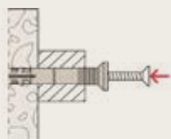
Inserta el taquete-tornillo