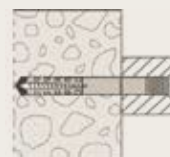
Listo para sostener