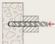
Perforar con Broca 1/4"